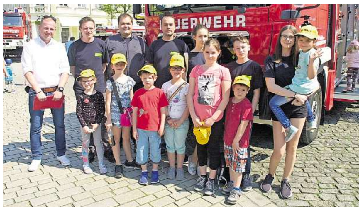
Für die Mitglieder der Jugendfeuerwehr aus Haina war der Aktionstag am Samstag ein lohnendes Ausflugsziel.