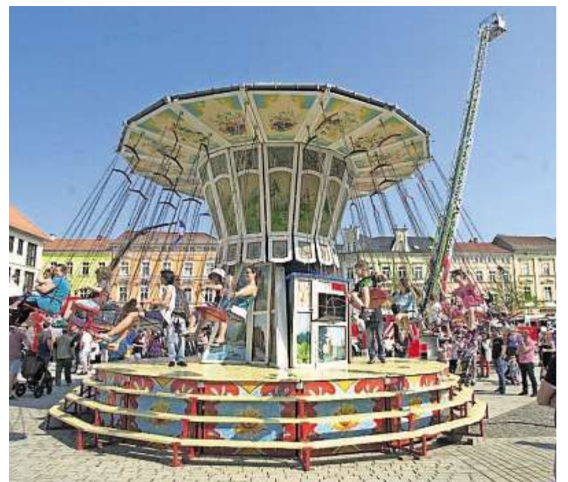
Volksfestcharakter brachte auch das Kettenkarussell auf die Blaulichtmeile.