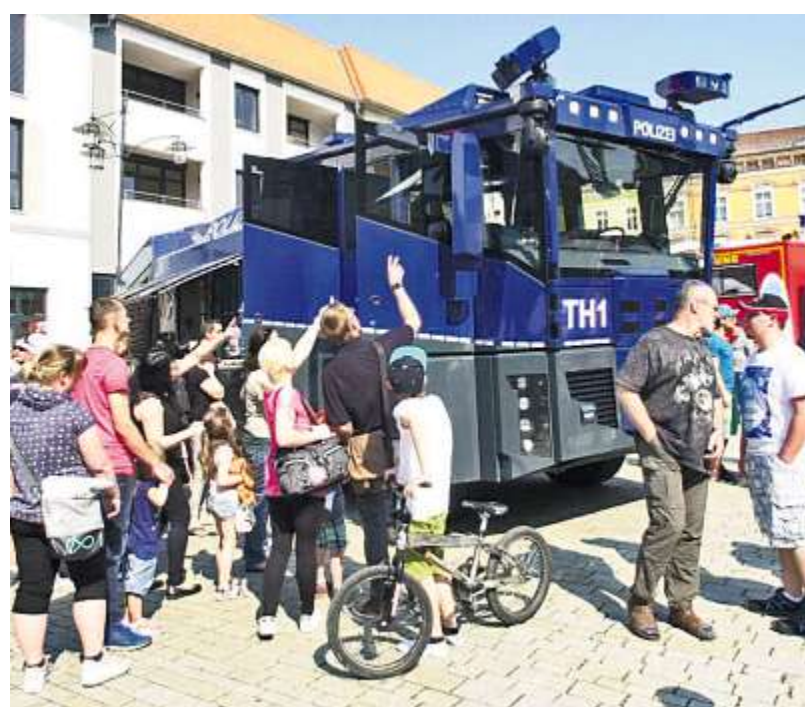
Hoffentlich in Meiningen nie gebraucht, dennoch notwendig – ein Wasserwerfer.