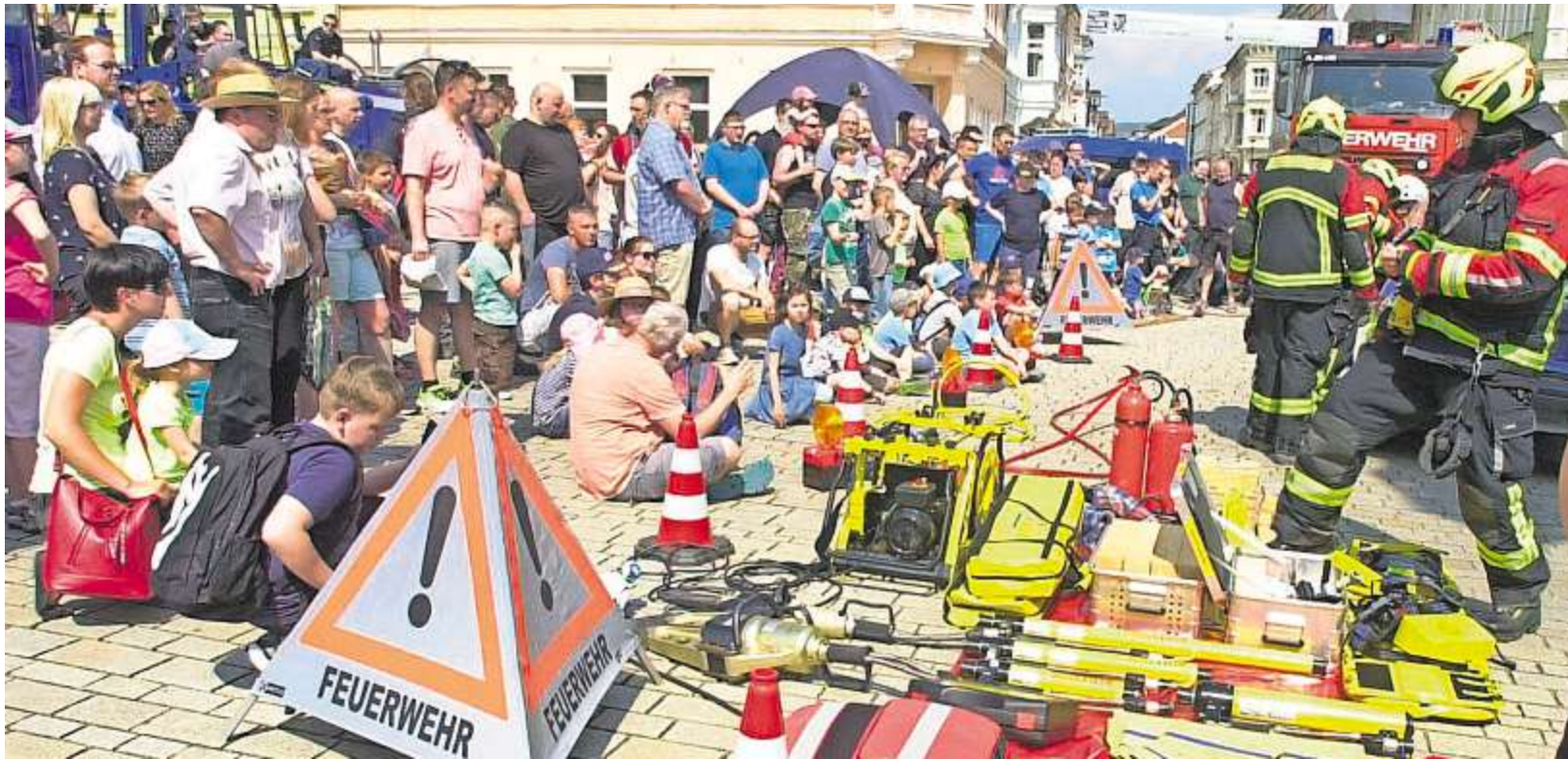
Die Feuerwehr bei der 1. Meiningener Blaulichtmeile in Aktion – einer der Anziehungspunkte für die zahlreichen Besucher auf dem Marktplatz der Theaterstadt. Der Aktionstag begann um 11 Uhr und endete am späten Nachmittag.